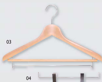
ウッドハンガー 15 クリアー

※クリアーのみ。色つきはオーダーハンガーよりご選択ください。 アンダーパーツは変更できません。