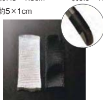
スベリ止メッシュ (半透明・黒)