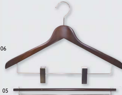
ウッドハンガー 15 ブラウン