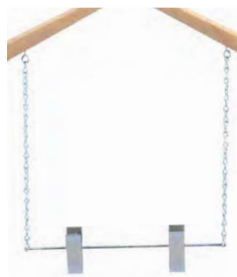
クリップ (吊り下げ)