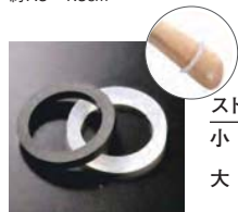
ストップリング (白・黒)